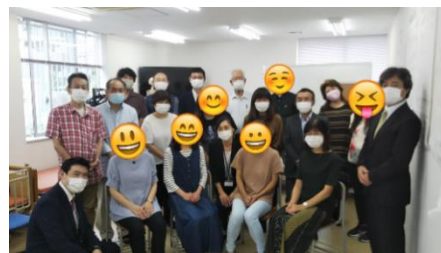
<修了式での記念撮影>