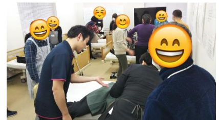
<当校での授業風景（実技演習）>

【日程】 10月6日（火）～11月27日（金）の毎週火・金曜日 ☆祝祭日含む 9時20分～16時40分 ☆1コマ60分×6コマ（昼食休憩あり）