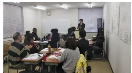
<当校での授業風景（グループワーク）>