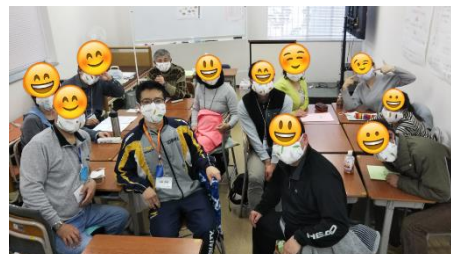
<実技演習の1コマ（自作マスク作り）>

「市進ケア教育研究所」で検索→申込ページより 必要事項を入力の上、お申し込みください。 ※webの場合も②と同様、仮の申込受付となります。