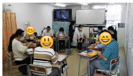
<実習風景 (マスク作り)>

「市進ケア教育研究所」で検索→申込ページより必要事項を入力の上、お申し込みください。 ※ web の場合も②と同様、仮の申込受付となります。