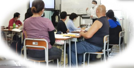
学び合い、笑い合おう!!