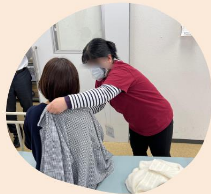
実践に即した 実技授業