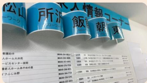
充実の就職コーナー