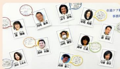
バラエティー豊かな講師陣